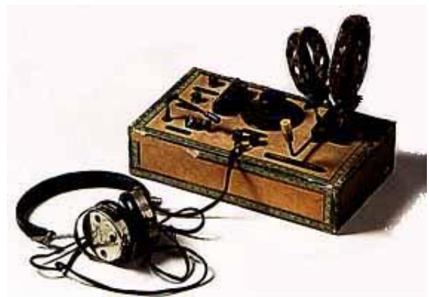
KIT POUR BOITE DE CIGAR

Pour le peuple il y a les radios en Kit de la Cie W.Fritz de Stuttgart.