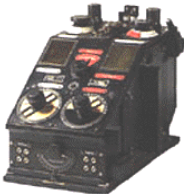
Telefunken E 85

Le premier poste radio de l'infanterie est un "Telefunken E 85 c", avec un peu de chance on peut capter Berlin.