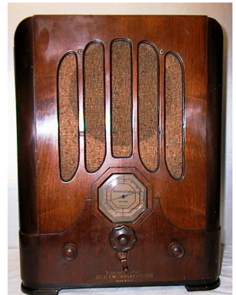
Radio to be raffled / Radio du Tirage Stromberg-Carlson Canada, 61-TA

Members $20.00 per person, at the door. Two spacious halls. One for exhibition; while the other is for dining and relaxation. Unload your vehicle effortlessly, with direct access to the hall.