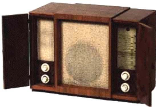
SIEMENS CASKET 76W

Les appareils sont plus facile à utiliser, vers le milieu des années 30 (chez Saba le fameux œil magique fait son apparition) alors que chez Siemens et Philips, on raffine les cabinets de bois et en 1937 la Bakélite fait son apparition chez Telefunken.