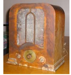
Paul-Joseph Duval Grunow 470