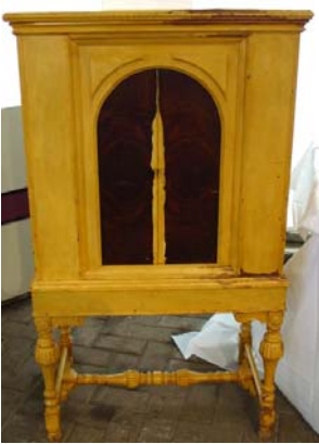
Eric Bélanger PHILCO 95 DeLuxe

Bonjour les amis, juste un mot et quelques photos pour vous rappeler qu'il ne vous reste que 2 mois pour compléter les restaurations de vos épaves, courez car le temps lui, il court!!!