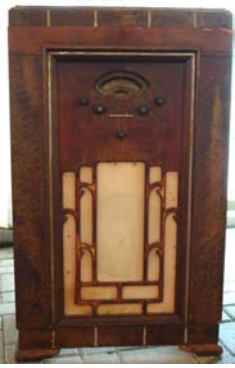
Serge Hainault Atwater-Kent 510