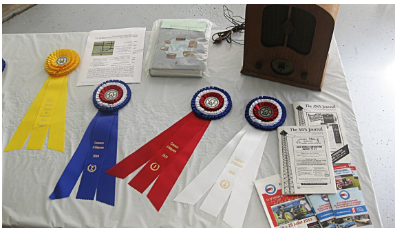
Les prix du concours d'élégance.