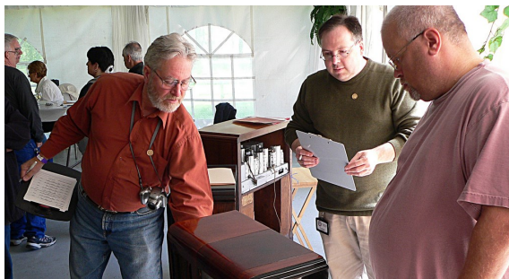
Les juges du concours de restauration à l'oeuvre.