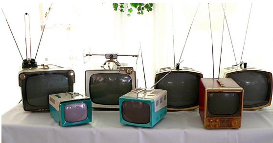
Et pourquoi pas les télé portatives!