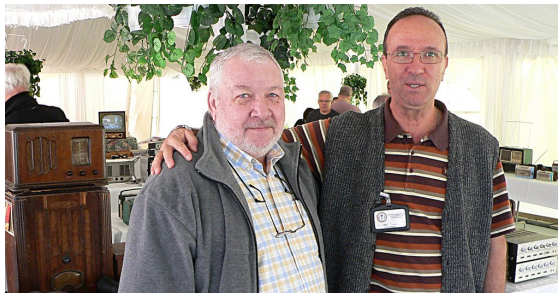
Les copains heureux de se voir enfin après avoir communiqué si longtemps par courriels.