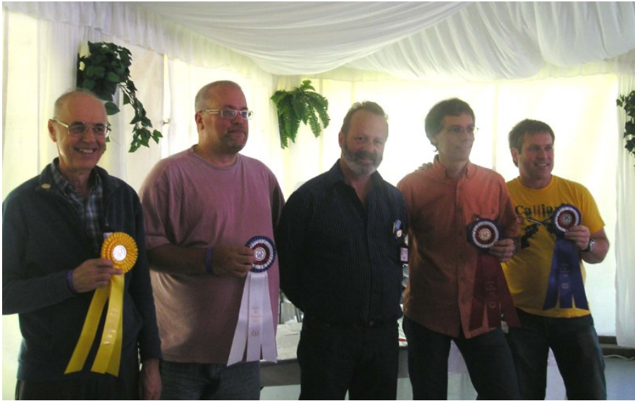
LES LAURÉATS DU CONCOURS DE RESTAURATION