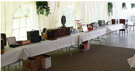
Une partie du concours d'élégance qui avait pour thème les radios portatifs.