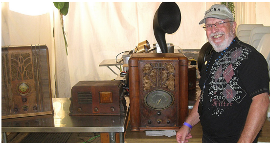
Un homme et son péché...